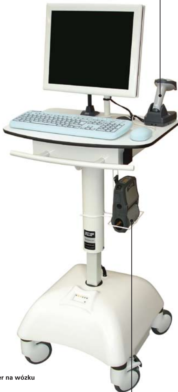
Komputer na wózku

Przenośna drukarka etykiet: drukarka Zebra z serii QL Plus™