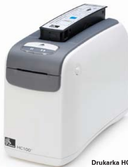
Drukarka HC100 i wkład z opaskami